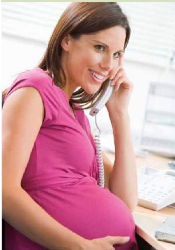
Du kan trygt tale i fastnettelefon